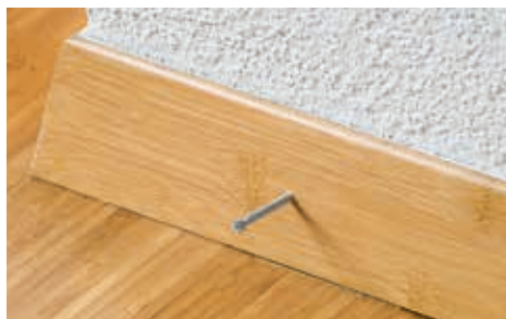
Bevestiging van plinten